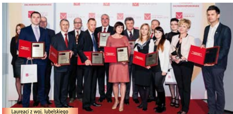
Laureaci z woj. lubelskiego