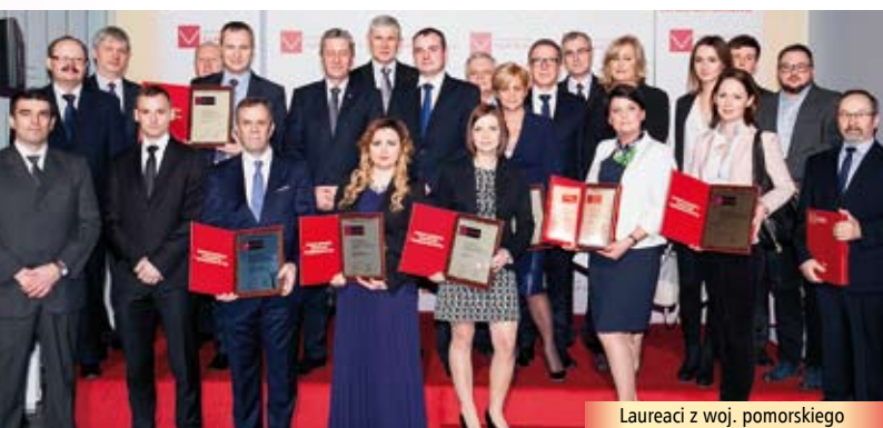
Laureaci z woj. pomorskiego