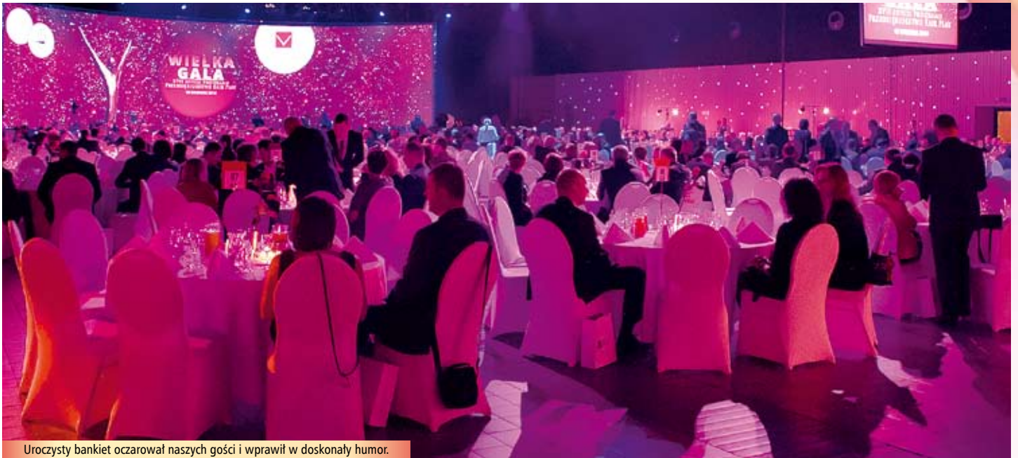
Uroczysty bankiet oczarował naszych gości i sprawił w doskonały humor.