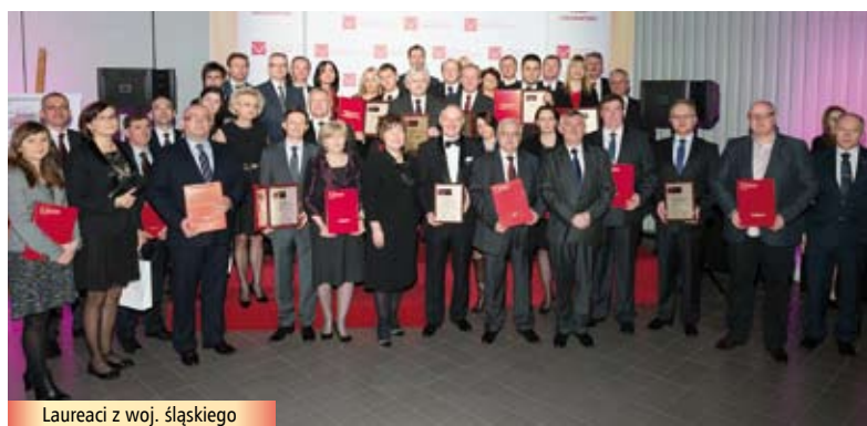
Laureaci z woj. śląskiego