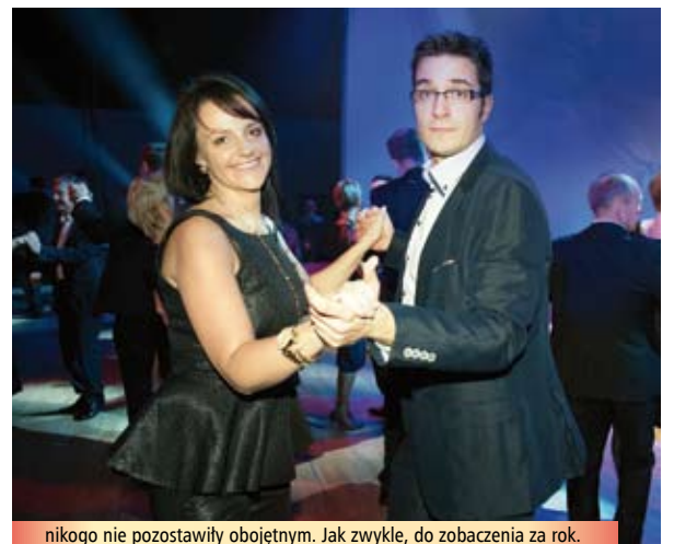
nikogo nie pozostawili obojętnym. Jak zwykle, do zobaczenia za rok.