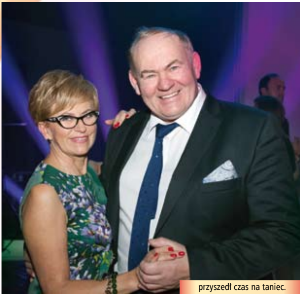
przyszła czas na taniec.