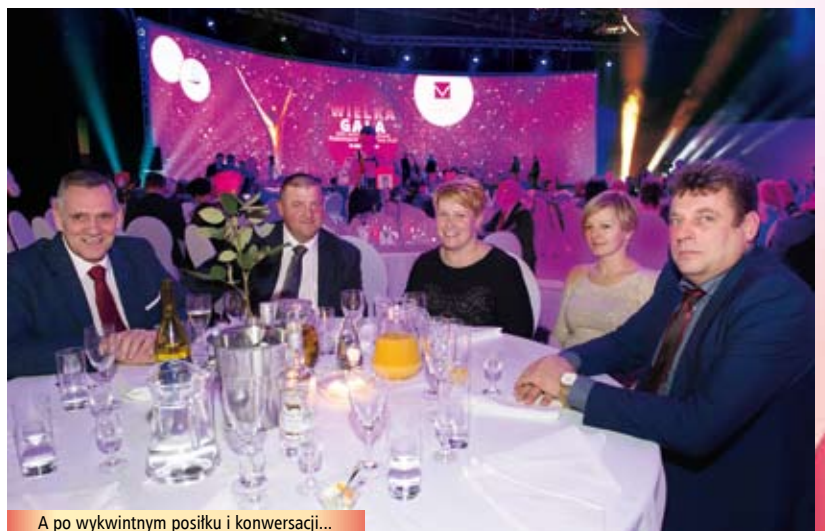
A po wykwintnym posiłku i konwersacji...