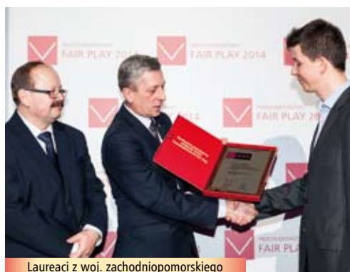
Laureaci z woj. zachodniopomorskiego