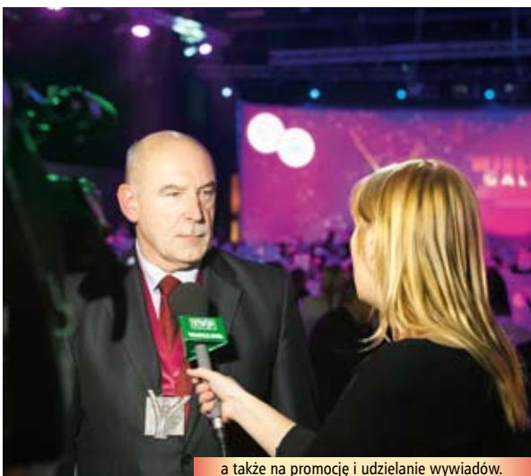
a także na promocję i udzielanie wywiadów.