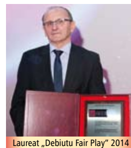
Laureat „Debiutu Fair Play” 2014