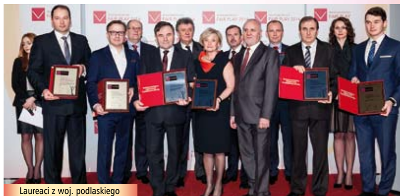
Laureaci z woj. podlaskiego