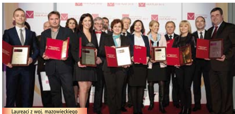
Laureaci z woj. mazowieckiego