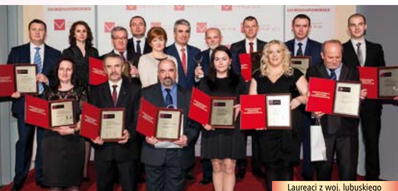
Laureaci z woj. lubuskiego