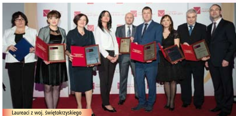
Laureaci z woj. świętokrzyskiego