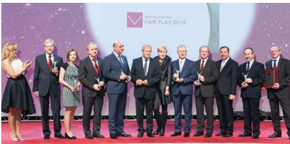
Laureaci programu „Przedsiębiorstwo Fair Play”. Wyróżnienie za szczególną działalność proekologiczną

Zespół Ciepłowni Przemysłowych „CARBO-ENERGIJA” Sp. z o.o. Ruda Śląska, woj. śląskie www.carboenergia.pl