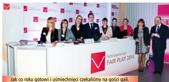
Jak co roku gotowi i uśmiechnięci czekaliśmy na gości gali.