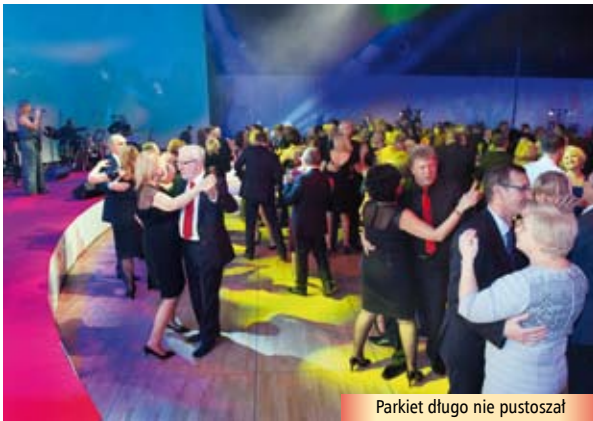
Parkiet długo nie pustoszał