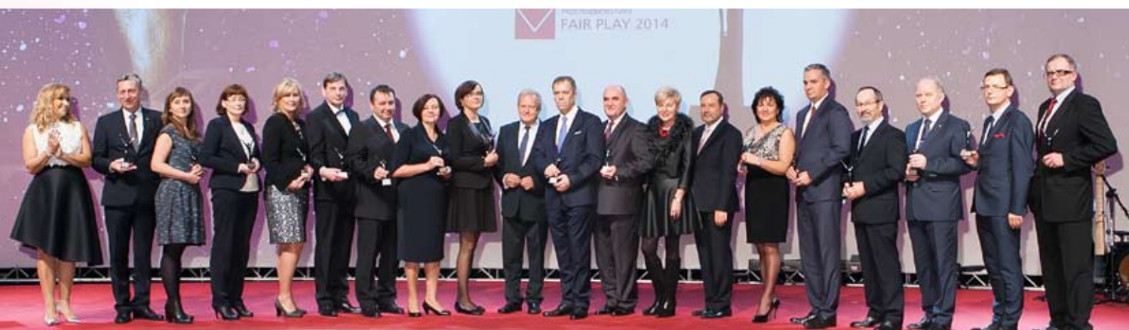
Laureaci Diamentowej Statuetki „Przedsiębiorstwo Fair Play” 2014

ZAKŁAD CHEMICZNO-FARMACEUTYCZNY „FARMAPOL” Sp. z o.o. Poznań, woj. wielkopolskie www.farmapol.pl