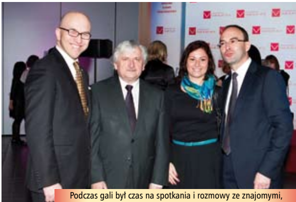
Podczas gali był czas na spotkania i rozmowy ze znajomymi,