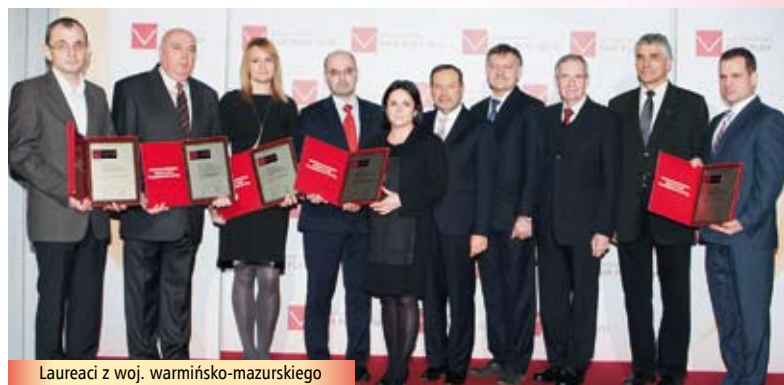
Laureaci z woj. warmińsko-mazurskiego