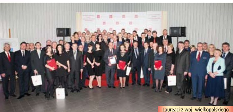
Laureaci z woj. wielkopolskiego