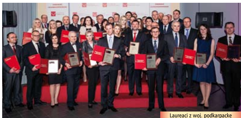
Laureaci z woj. podkarpackie