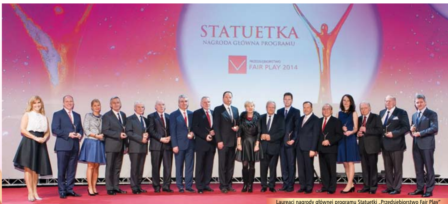
Laureaci nagrody głównej programu Statuetki „Przedsiębiorstwo Fair Play”