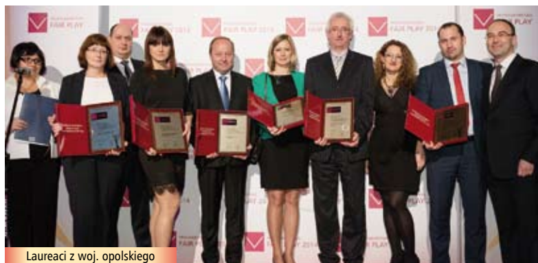
Laureaci z woj. opolskiego