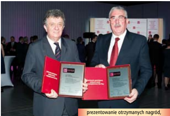
prezentowanie otrzymanych nagród,