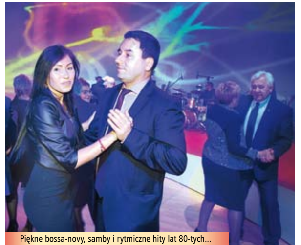
Piękne bossa-novy, samby i rytmiczne hity lat 80-tych...